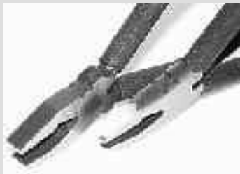
Detailansicht der PROVETRO-Zangen PCJ-1 (32 130 00) und PCJ-5 (32 131 00).

We have considerably extended the range of our products especially for glaziers, the glass industry and all companies incorporating the use of thick glass.