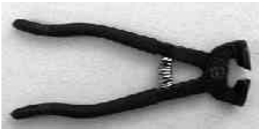
32 165 00 Mosaik-Zange / Mosaic plier