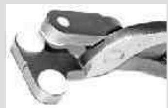
Detailansicht 32 117 00