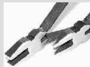
Detailansicht der PROVETRO-Zangen PCJ-3 (32 132 00) und PCJ-8 (32 134 00).

can start cuts especially gently and controlled. Complicated curved cuts can be achieved additionally.