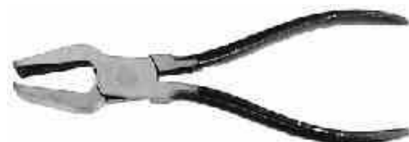
32 118 30 PROVETRO Dickglas Brechzange / Pliers for thick glass P-510 210 mm L., 23 mm Backenbreite, ummantelter Griff (ideal für 3 - 16 mm Glas) 210 mm, 23 mm jaw width, coated grip, for 3 - 16 mm glass