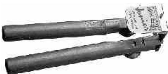
00 311 00 ZAG-ZAG Mosaik-Zange / Mosaic pliers "Junior" 703.5