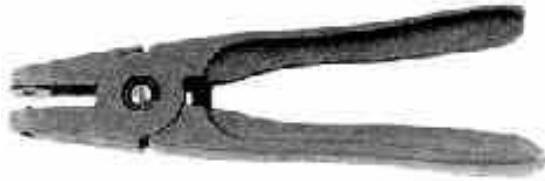
32 111 00 RING STAR Laufzange / RING STAR running pliers Kunststoff / Synthetic