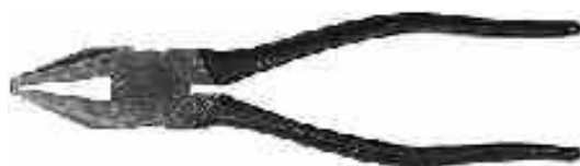
32 135 00 Brechzange, 160 mm L., 12 mm Backenbreite, ummantelter Griff Breaking pliers, 160 mm, 12 mm jaw width, coated grip