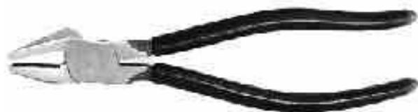
32 118 00 PROVETRO Dickglas Brechzange / Pliers for thick glass P-210 220 mm L., 22 mm Backenbreite, ummantelter Griff (ideal für 5 - 12 mm Glas) 220 mm, 22 mm jaw width, coated grip, for 5 - 12 mm glass