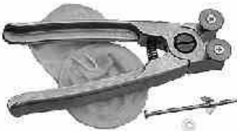
32 160 00 ZAG-ZAG Mosaik-Zange / Mosaic pliers 701.0 32 160 01 Ersatzrad / Repl. wheel 32 160 02 Splitterfangbeutel / splinter catcher