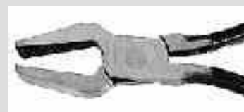
Detailansicht 32 118 30