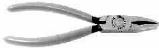
KNIPEX Brech- und Kröselzange, 160 mm L., ölgehärtete Backen, ummantelter Griff

Breaking and grozing pliers, oil tempered jaw, coated grip