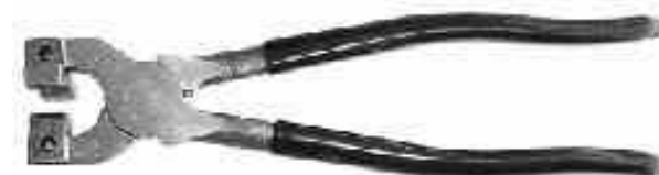
32 117 10 PROVETRO Dickglas Laufzange / Pliers for thick glass PRP-4 230 mm L., 50 mm Backenbreite, ummantelter Griff (ideal für 2 - 19 mm Glas) 230 mm, 50 mm jaw width, coated grip, for 2 - 12 mm glass