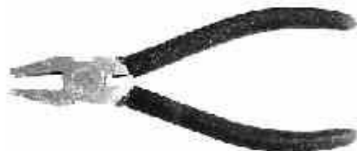
32 132 00 PROVETRO- Brechzange PCJ-3, 165 mm L., 10 mm Backenbreite, (ideal für 2 - 6 mm Glas) Breaking pliers, 165 mm, 10 mm jaw width, for 2 - 6 mm glass