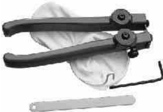
00 310 00 ZAG-ZAG Mosaik-Zange / Mosaic pliers 703.01 00 310 01 ZAG-ZAG Feder / Repl. spring 00 310 02 ZAG-ZAG Splitterbeutel / splinter catcher 00 310 03 ZAG-ZAG Ersatzrad / Repl. wheel