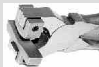
Detailansicht 32 117 10