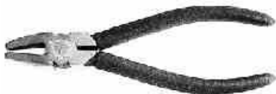
32 134 00 PROVETRO Fischlippen-Kröselzange PCJ-8, ummantelter Griff 5 mm Backenbreite (ideal für 2 - 5 mm Glas) Grozers pliers "fishlip", coated grip, 5 mm jaw width, for 2 - 5 mm glass