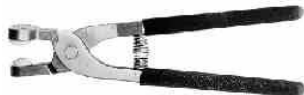
32 117 00 PROVETRO Dickglas Laufzange / Pliers for thick glass PRP-2N 230 mm L., 45 mm Backenbreite, Backen mit Kunststoff belegt, ummantelter Griff (ideal für 6 - 16 mm Glas) 230 mm, 45 mm jaw width, synthetic tips, coated grip, for 6 - 16 mm glass