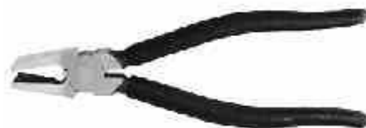
32 133 00 PROVETRO- Brechzange PCJ-4, 22 mm Backenbreite , (ideal für 2 - 12 mm Glas) Breaking pliers PCJ-4, 22 mm jaw width, for 2 - 12 mm glass