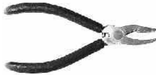
Brech- und Kröselzange, 155 mm, ummantelter Griff, (ideal für 2 - 5 mm Glas)

32 127 00 4 mm Backenbreite / jaw width, mit Rückstellfeder / spring return