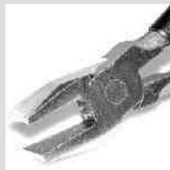
Detailansicht 32 118 00