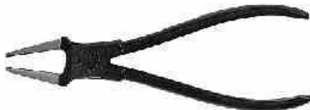
32 140 00 KNIPEX Brechzange, 180 mm L., 22 mm Backenbreite, er- leichtert das Brechen schmaler Streifen Breaking pliers, 180 mm, 22 mm jaw width, easy breaking of small stripes