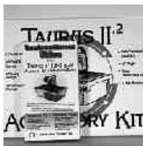
31 365 20 Ergänzungssatz Accessory kit