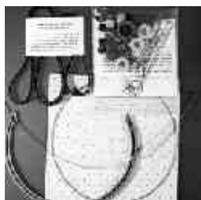
31 365 19 Ersatzteilset Replacement kit